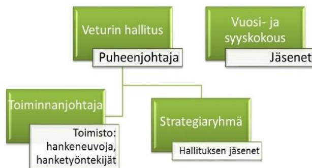
Kuva. Ylä-Savon Veturin organisaatio.

Yhdistyksen vuosi- ja syyskokouksissa jäsenet vahvistavat yhdistyksen talousarvion ja toimintasuunnitelman sekä päättävät tilinpäätöksen hyväksymisestä. Syyskokous valitsee hallituksen jäsenet ja puheenjohtajan.